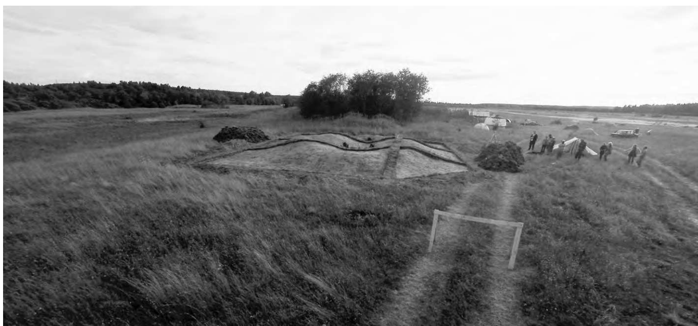
Общий вид кургана Дн-58, исследованного в 2015 г.