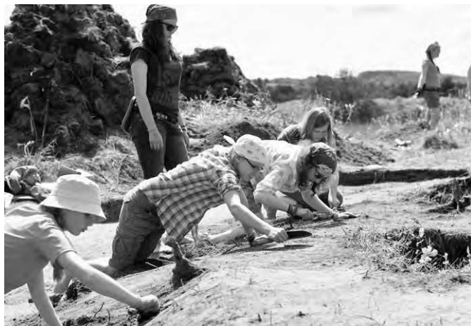
Раскопки насыпей курганов Дн-56 и Дн-57 в 2012 г.