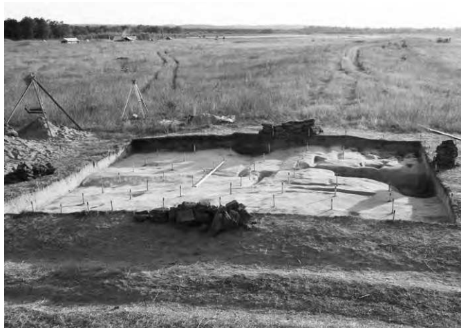
Общий вид участка исследований 2014 г.

трофических или загадочных обстоятельствах. Такие насыпи называются кенотафами. Тем не менее, более логичным объяснением кажется то, что в этом кургане было совершено захоронение по обряду трупоположения на горизонте, а кости, из-за особенностей почвы, не сохранились. Стоит оговориться, что подобных достоверных погребений в Гнездове пока не зафиксировано, зато они прекрасно известны нам по материалам других синхронных могильников Древней Руси.