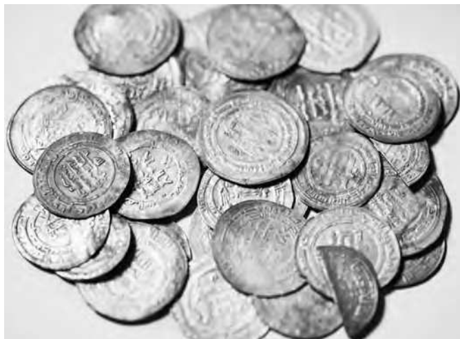
Клад арабских монет 2010 г.