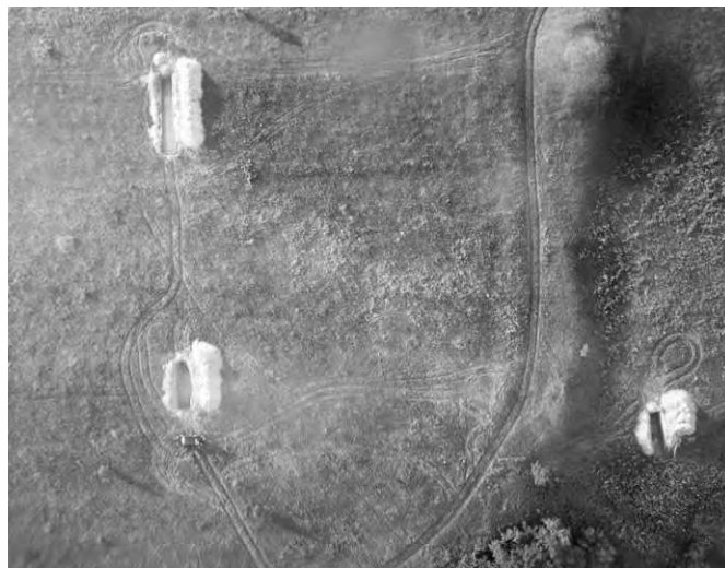
Общий вид разведочных траншей для палеоландшафтных реконструкций. Исследования 2018 г. Вид сверху

В 2017 году были предприняты исследования двух курганов, расположенных в западной части Днепровской группы, друг с другом рядом. Обе насыпи были сильно нарушены кладоискательскими ямами в центральной части. Таким образом, изначально была большая вероятность того, что погребения могут быть сильно повреждены. Меньший курган содержал захоронение по обряду трупосожжения на месте. Действительно, центральная, обычно наиболее информативная часть сожжения, оказалась уничтоженной. Инвентарь погребения оказался совсем не богат и состоял из кругового сосуда, фрагментов костяного гребня, сильно оплавленных и потому неопределимых железных и бронзовых предметов. Значительно интереснее были результаты исследований второго кургана. Под насыпью выявлено камерное захоронение, незначительно нарушенное грабительской ямой в верхней части. В планах и разрезах, зафиксированных в ходе раскопок, хорошо видны остатки деревянных конструкций стен и потолка, со временем завалившиеся внутрь ямы. Инвентарь захоронения состоял из кресала и фрагмента арабской монеты. Как и курганы, исследованные ранее, насыпи датируются серединой – второй половиной X века.