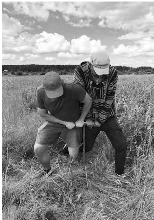
Разведочное ручное бурение. Исследования 2018 г.