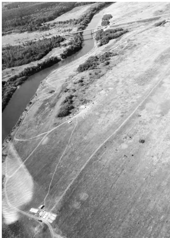
Вид на Днепровскую курганную группу с самолета

Еще одной задачей стал поиск поселения в окрестностях курганной группы. По ряду причин, прежде всего из-за относительной близости от центральной части Гнездов-