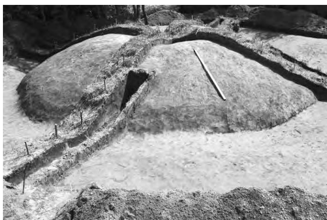
Курган Дн-53 в процессе раскопок 2011 г.

неты, сокровище было спрятано во второй половине 930-х годов. В Гнездове обнаружено немало кладов, почти 15. Особенностями клада 2010 года является то, что это первый, найденный вне распространения культурного слоя поселений, и первый, обнаруженный вне центральной зоны памятника.