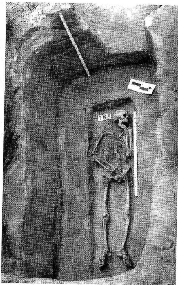
Рис. 2. Поховання XI ст. (поховання № 158. Дослідження О.В. Шекуна по вул. Куйбишева, 13 1988 р.)