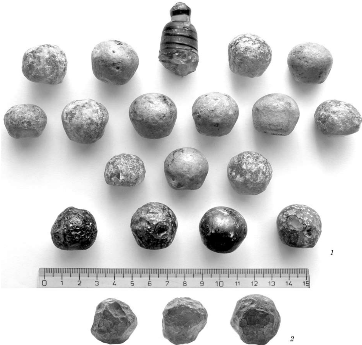
Рис. 1. Гральний набір з кург. VI/98 Шестовицького заплавного могильника (сучасний вигляд): 1 — гральні фігурки, що знаходяться в експозиції Музею археології ІА НАНУ, 2 — гральні фігурки, що зберігаються у Наукових фондах ІА НАНУ

Ханенко В. 1902, № 1271—1272), проте детальнішої інформації про них немає.