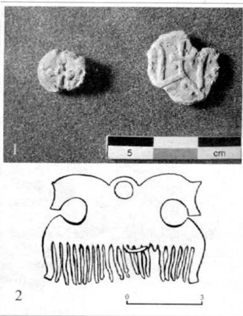
Рис. 1. Находки из Тимерево. 1 — пломба и печать (свинец), сборы начала 1990-х гг.; 2 — гребень (бронза), пахотный слой

С 1984 г. начались планомерные раскопки комплекса, причем основное внимание было уделено исследованию могильника. За указанный период было доследовано девять курганов, имевших повреждения насыпей в виде ям и траншей (рис. 2). По сведениям М. В. Фехнер, таковых