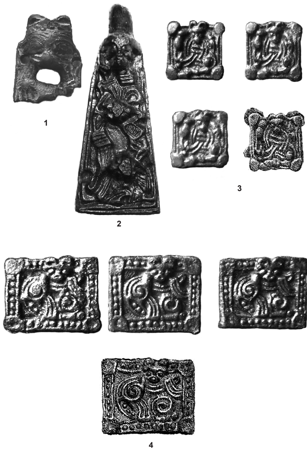
Рис. 2. Фibuла и детали конской сбруи. 1 – fibула из Тимерёвского поселения; 2-4 – детали конской сбруи из Тимерёвского некрополя. 1– бронза, позолота; 2-4 – бронза.