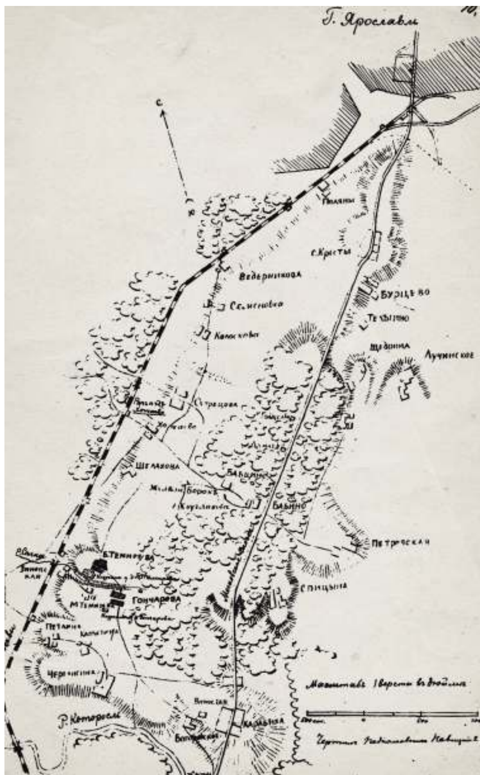
Рис. 3. Карта местности с указанием курганных могильников у д. Большое Тимерёво, Малое Тимерёво и Гончарово, созданная подполковником И. М. Новицким 2-м.

Fig. 3. Map of the locality with indication of kurgan burial grounds near the villages of Bolshoye Timerevo, Maloye Timerevo and Goncharovo drawn by lieutenant-colonel I. M. Novitskiy 2.