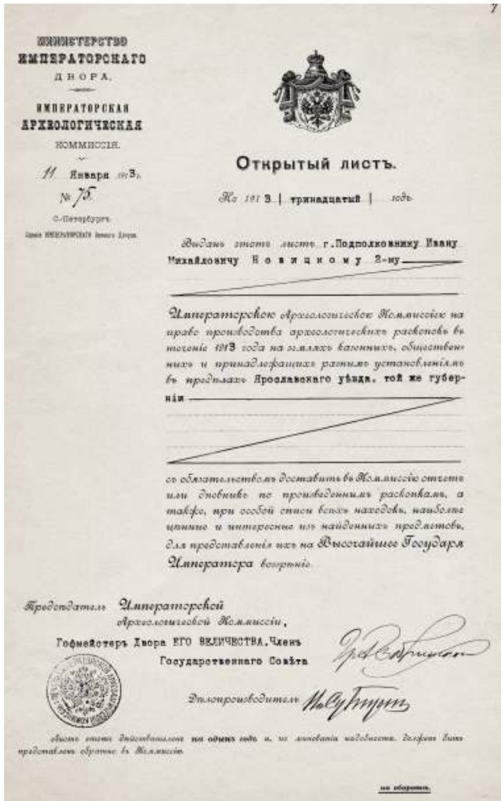
Рис. 1. Открытый лист, выданный Императорской археологической комиссией на имя подполковника Ивана Михайловича Новицкого 2-го. Январь 1913 г.