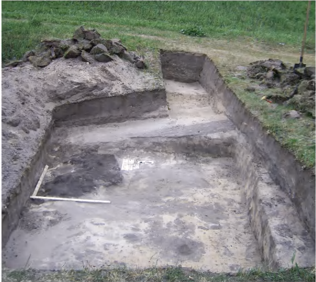
Рис. 3. Житло кінця IX ст. на посаді Виповзівського городища