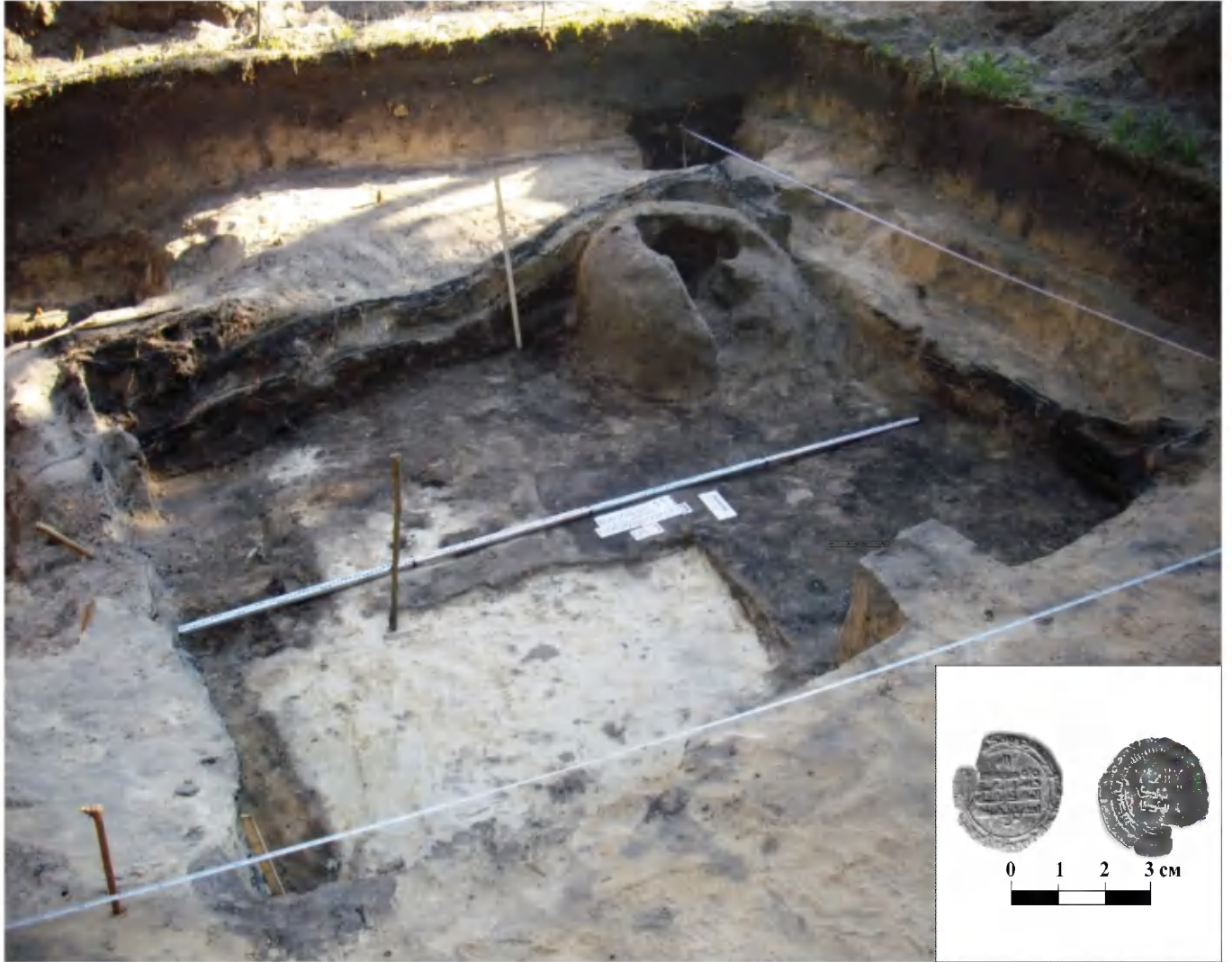
Рис. 6. Житло кінця IX – початку X ст. у розкопі № 3 (2011 р.) на посаді Виповзівського городища