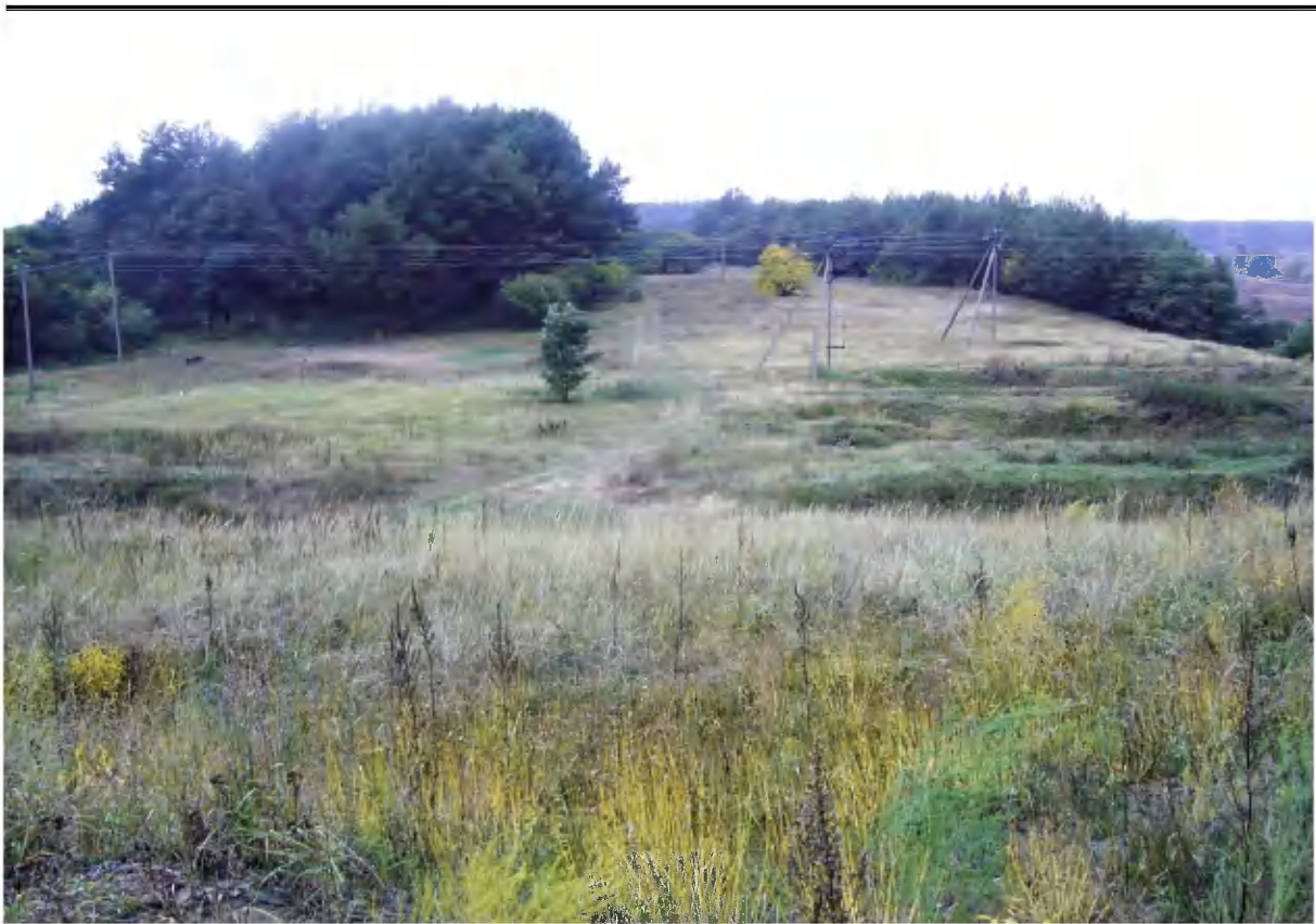
Рис. 1. Посад Виповзівського городища. Вид з сходу