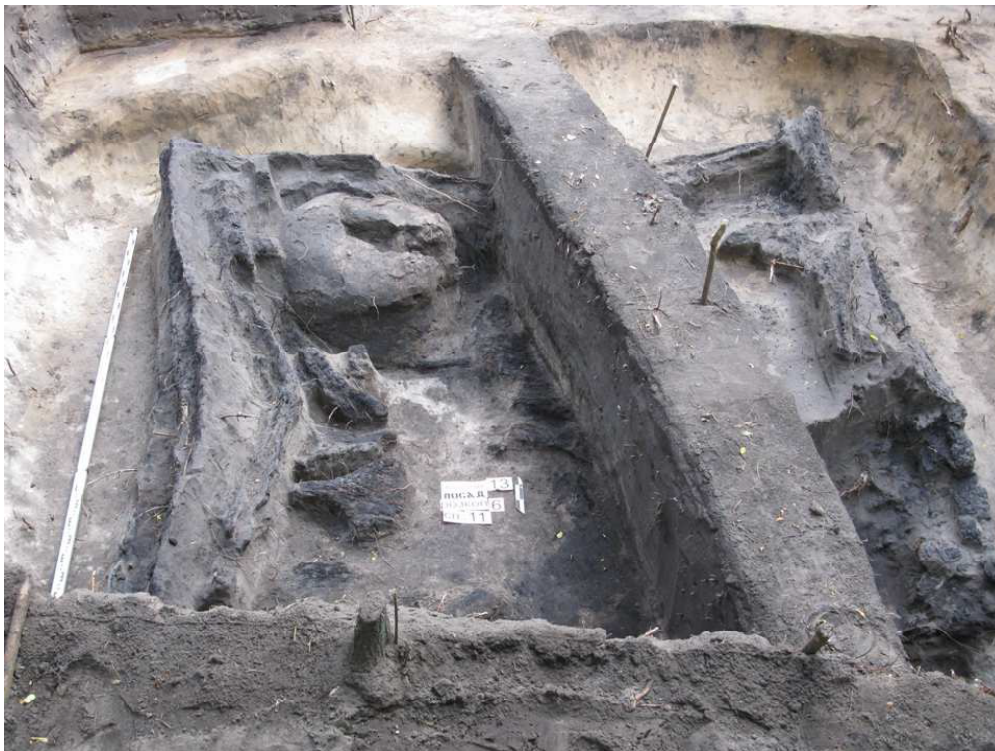
Рис. 1. Житло (споруда 11) у розкопі № 6 на посаді Виповзівського городища.