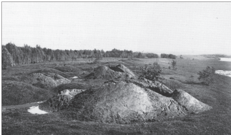
Гнездовские курганы. 1901 г.

раз Бюро о необходимости для неотложных хозяйственных надобностей нарушить какую-либо могильную насыпь, дабы она могла быть сперва научно исследована, раскопана и запротоколирована.