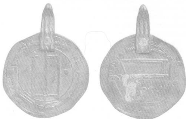
Рис.2. Дирхем (увеличено)