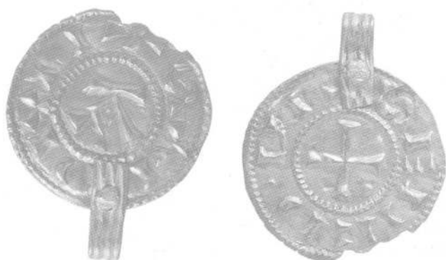
Рис.3. Денарий (увеличено)