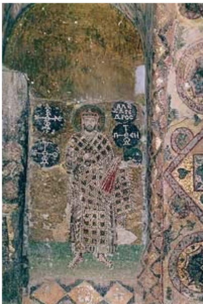
Мозаичный портрет императора Александра из храма святой Софии, X в.

исторические хроники, правил Александр на редкость бездарно и вел праздный образ жизни.