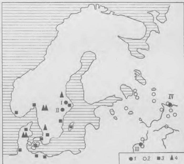
Карта распространения амулетов — символов Тора в VIII—XI вв.

сколько эта категория вещей не имеет никаких признаков, говорящих о принадлежности их к культу бога Тора, мы не считаем возможным рассматривать их вместе с какой-либо из трех вышеуказанных категорий; на них нельзя распространять ни хронологию, ни какие-либо выводы и определения, базирующиеся на ана-