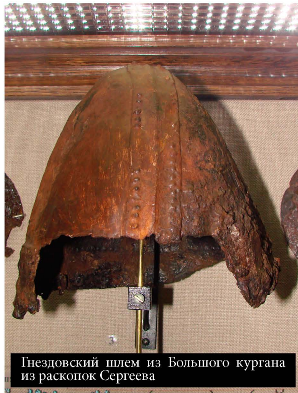
Гнездовский шлем из Большого кургана из раскопок Сергеева

Дело в том, что помимо Гнездова, на древнерусской территории известна еще только одна доспешная пластина, уверенно относящаяся к X веку. Она была найдена в Ярославской области на селище, расположенном рядом с Сарским городищем.