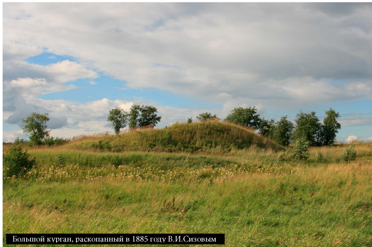
Большой курган, раскопанный в 1885 году В.И.Сизовым

Современный Смоленск отстоит от Гнездова на 15 км, и культурного слоя с находками древнее