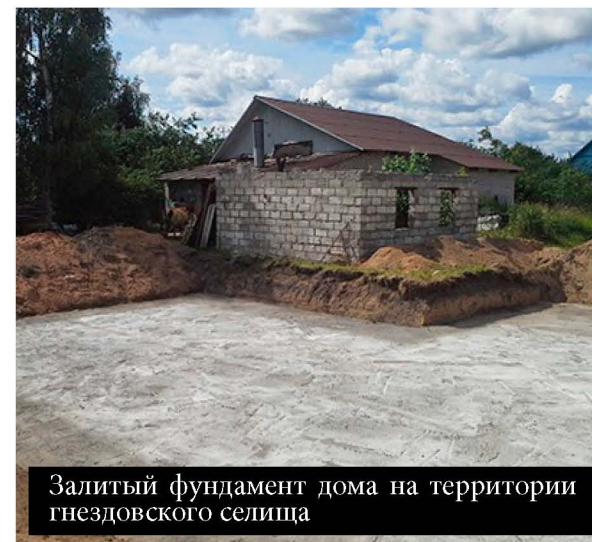
Залитый фундамент дома на территории гнездовского селища

С середины – второй половины X века все более многочисленными среди древнерусского оружия становятся предметы, аналогии которым можно найти среди степных, кочевнических древностей. Именно к таким находкам относится и упомянутый гнездовский шлем.