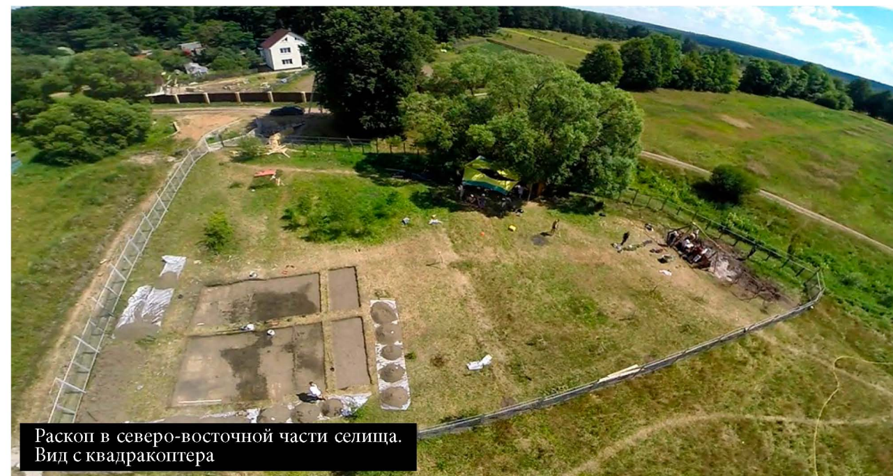
Раскоп в северо-восточной части селища. Вид с квадрокоптера

Если не принять срочные меры, то Центральная курганная группа, западные части Лесной и Глущенковской курганной групп, а также северная часть поселения будут потеряны для науки и Русской Истории. Скоро, целиком и безвозвратно.