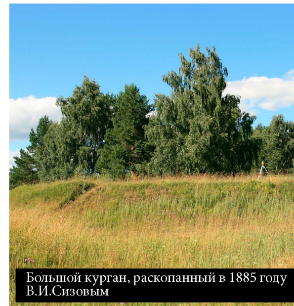
Большой курган, раскопанный в 1885 году В.И.Сизовым

В Гнездово же, в результате «переноса города» в XI веке, поселение и могильники X века относительно хорошо сохранились и позволяют представить структуру раннего древнерусского города.