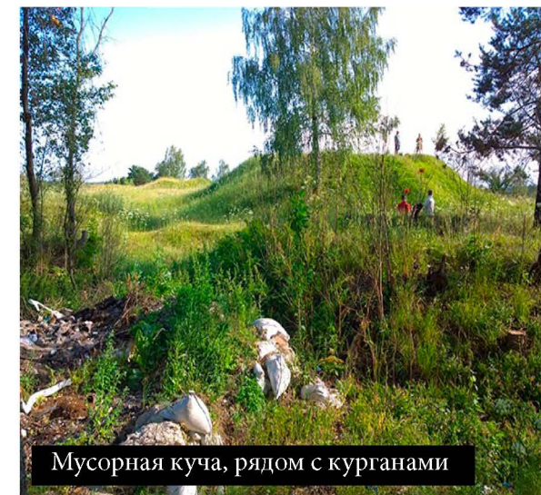
Мусорная куча, рядом с курганами

Чем жило Гнездово – ремеслом или торговлей?