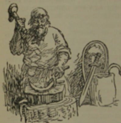
В мастерской ремесленника.

но чаще всего бывает, что черенок длиннее самого клинка, который вдобавок еще узкий, — это так называемый сапожный нож. Встречаются ножи с широким лезвием и коротким черенком, употребляемые в домашней работе. Изредка встречались охотничьи ножи с длинным лезвием. Как правило, ножи имели стальные лезвия. Вообще гнёздовские ножи, в зависимости от назначения, отличаются малыми размерами.