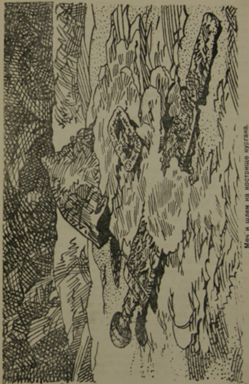
Меч и шлем на костре кургана.

Большой курган, раскопанный В. И. Сизовым в 1885 году, находился в юго-западной части центрального могильника на самой вершине холма, несколько на северо-запад от возвышающихся до сих пор нескольких больших курганов,