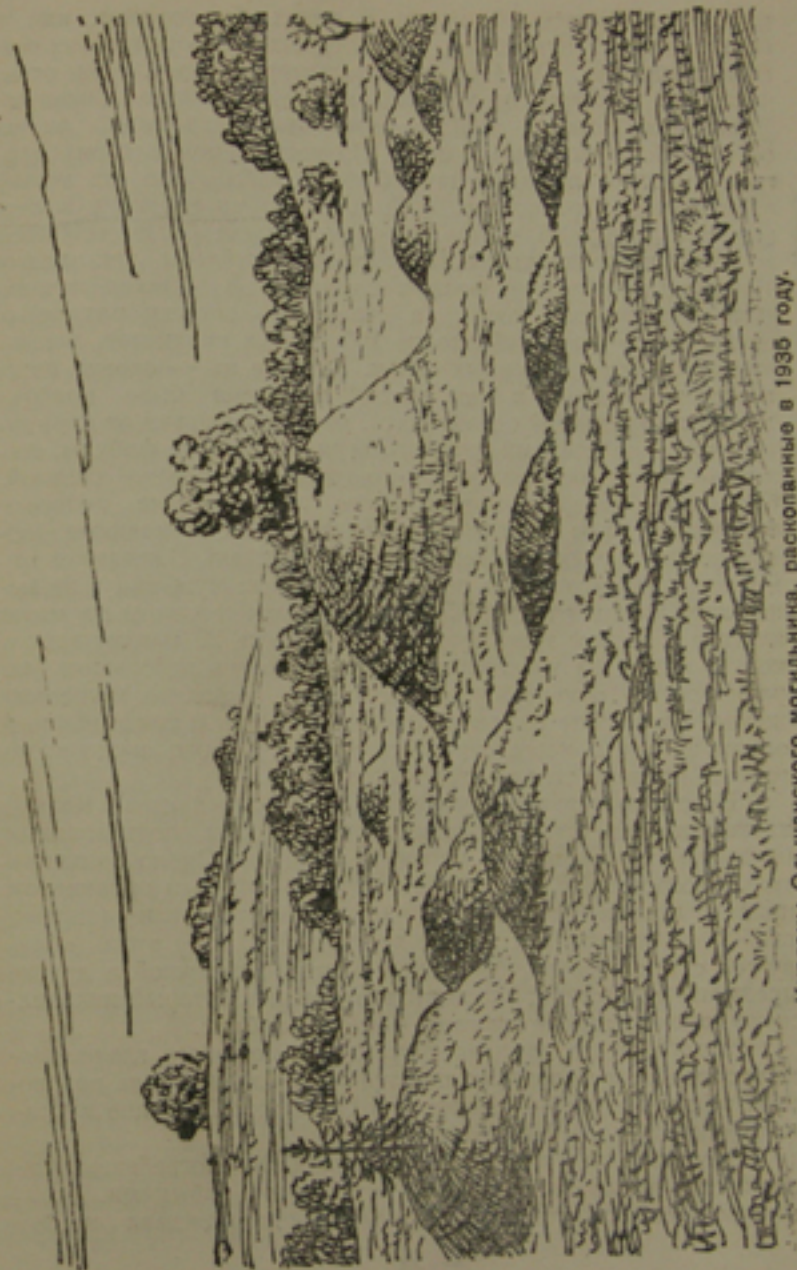
Курганы Ольшанского могильника, раскопанные в 1935 году.

Часто в Гнёздовском могильнике встречаются большие курганы, окруженные со всех сторон невысокими маленькими курганами. В больших курганах похоронены воины-витязи, а в маленьких курганах — рабы и животные. При этом кости