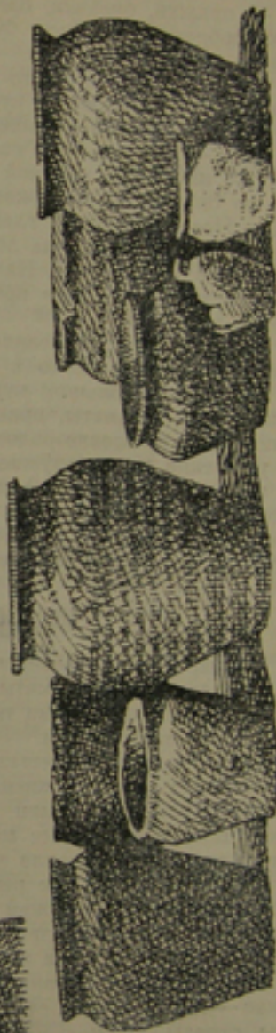
Лампочка Куцинского и типы урн, обнаруженных в курганах.