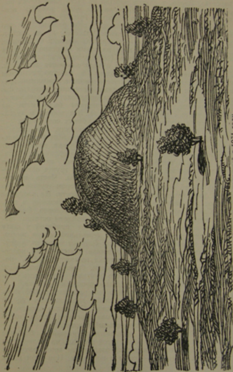
Большой курган, раскопанный в 1931 году.

У славян, как и у всех других народов, первой формой деления на классы было общество, основанное на рабстве. «Рабы и рабовладельцы — первое крупное деление на классы», — указывает В. И. Ленин. Это же подчеркнул И. В. Сталин. Он указал, что «все народы прошли стадию