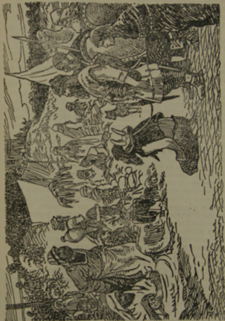
«Торг у древних славян». С картины С. Иванова.

В 1868 году при прокладке железной дороги в Гнёздове был найден знаменитый клад. Часть его из 108 предметов хранится в Эрмитаже в Ленинграде, а другая — в Историческом музее в Москве. Среди вещей этого клада в Эрмитаже есть две сассанидских диргема (название арабской монеты) 532 и 595 годов, восемь саманидских 908 — 953 годов. В Москве хранятся пять диргем с ушками, одна сассанидская монета,