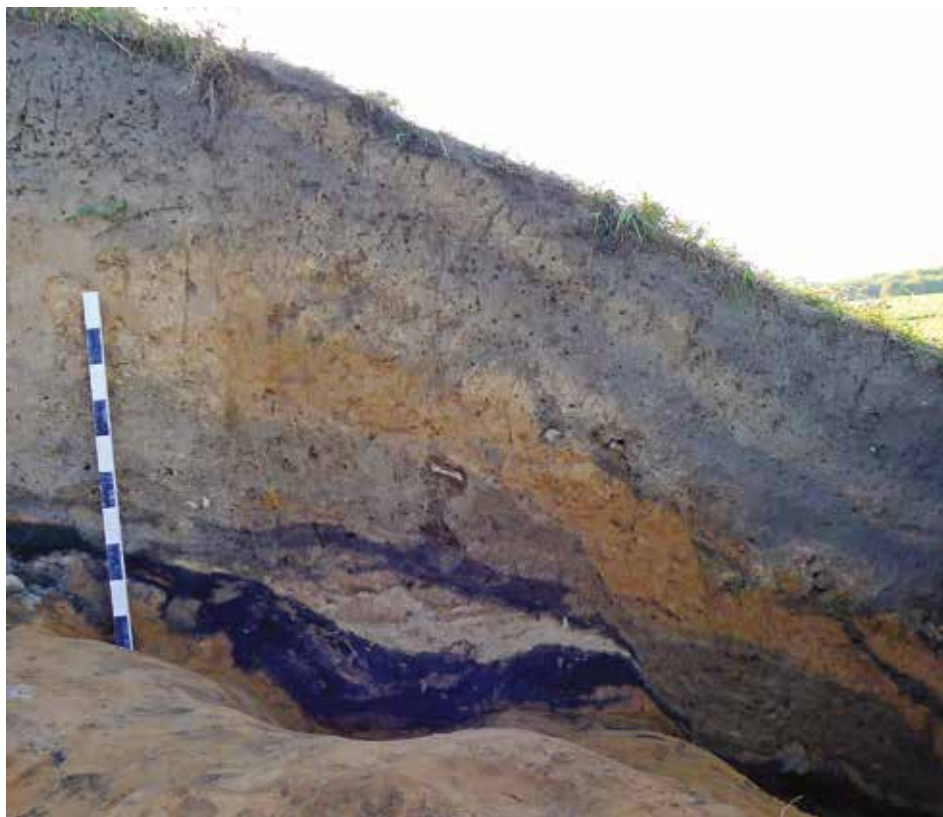
Рис. 7. Нижний горелый слой на уступе эскарпированного склона (Центральное городище)

Дальнейшее развитие фортификационной системы городища пока представить сложно ввиду малочисленности данных. Можно предположить, что во второй половине X в. укрепления были усилены и представляли собой дерево-земляные конструкции, расположенные как на площадке городища, так и на склоне. Характер первоначальных укреплений Центрального городища — сочетание эскарпа с деревянной стеной или облицовкой склона — близок системе роменских городищ X в. на Левобережье Днепра [14].