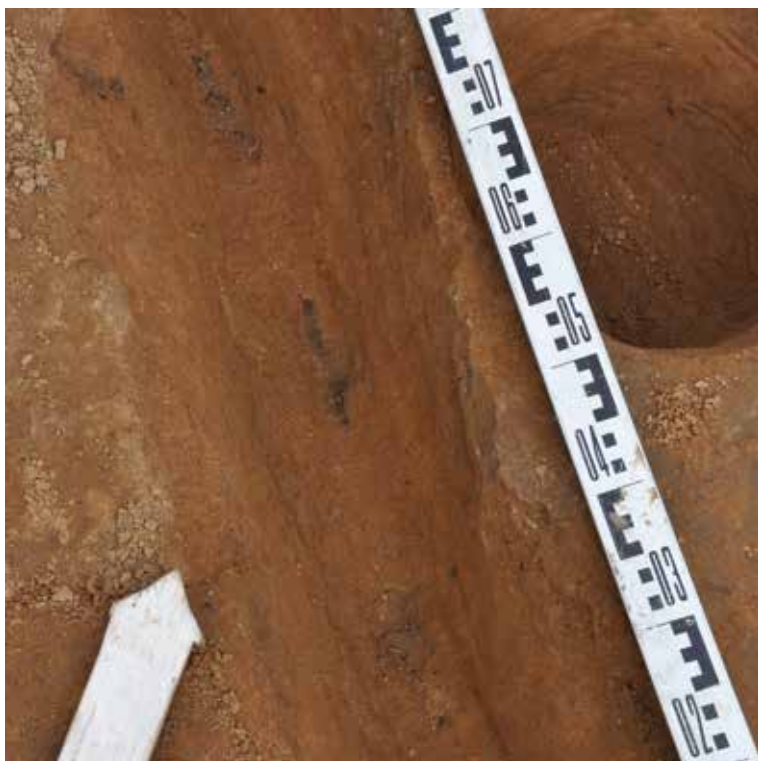
Рис. 2. Следы вертикально вбитых досок. Пойменная часть поселения (раскоп П-8)

Из сооружений, состоявших не только из наземной, но и из углубленной части, наиболее интересным представляется объект, изученный в 2010–2012 гг. Центральную его часть составляла яма (подпол?) глубиной около 1,3 м и поперечником более 3 м, с восточной стороны которой отчётливо читался сход. Загадкой является конструкция наземной части: система слоев, связанных с ямой была ограничена двумя идущими по кругу, параллельными канавками, в одной из которых зафиксированы столбовые ямки, в другой — следы забитых вертикально досок (рис. 2).