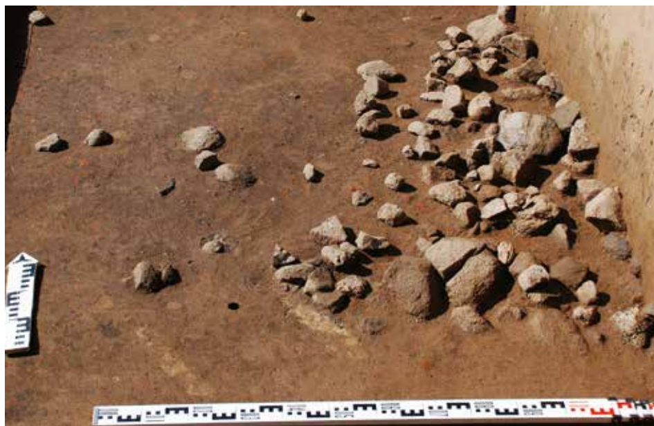
Рис. 1. Каменный очаг. Пойменная часть поселения (раскоп П-8)

Вопрос о том, использовался ли пойменный участок лишь сезонно или там возводились постройки для стационарного круглогодичного проживания, остаётся открытым до настоящего времени. Несмотря на то, что в ходе исследования выявлено большое количество каменных очагов (рис. 1), ни один из них не удаётся связать с конкретной постройкой и убедительно интерпретировать его как отопительное устройство. Вероятнее всего, постройки представляли собой наземные срубы, следы которых в культурном слое, не сохраняющем органику, зафиксировать сложно.