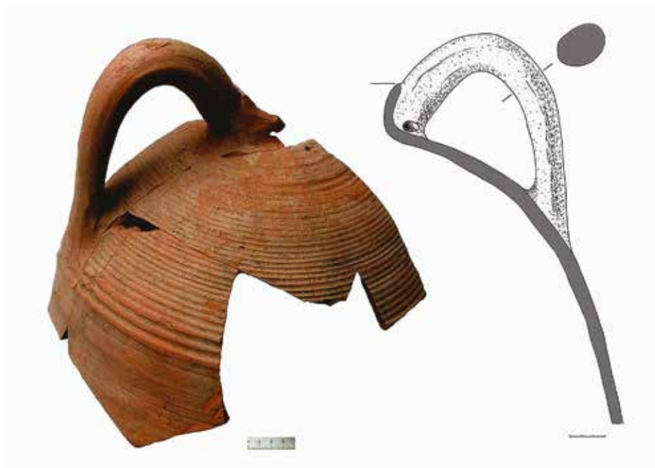
Рис. 5. Средневековая амфора (Центральное городище)

соответственно). Учитывая, что раннекруговая керамика в Гнёздове появляется не ранее 30-х гг. X в., этот горизонт можно отнести ко второй четверти — середине столетия. В пределах защищённого «нивелировочным» слоем участка отмечено скопление фрагментов византийских амфор, найдены свинцовая византийская печать, обрывки золотных нитей, осколки импортных стеклянных сосудов — всё это указывает на особый, неординарный характер его обитателей. По некоторым данным, одна из наиболее выраженных пожарных прослоек нижнего горизонта может быть сопряжена со слоем, насыщенным продуктами горения и обнаруженным во время раскопок 2010–2013 гг. на краю площадки и в верхней части южного склона городища. Перепад отметок на этом участке составил до 2,5 м.