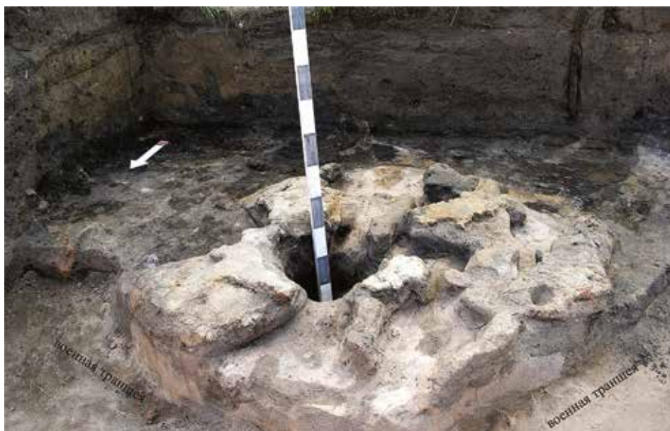
Рис. 6. Развал глиняных стен наземной конструкции (Центральное городище)

датирующихся XVI–XVII вв., позволяют отнести время формирования здесь основной части насыпного горизонта к XVII в. и связать его с какими-то масштабными работами, производившимися в этой части существовавшего ранее поселения. На небольшом участке площадью около 2 кв. м удалось зафиксировать прослойку погребённого дёрна, отделяющую насыпной горизонт от основного. Основной горизонт напластований, расположенный на краю площадки и распространяющийся вниз по склону на протяжении нескольких метров, характеризуется слоистой структурой и наличием нескольких углистых (пожарных?) прослоек. Самый нижний горелый слой фиксировал материковую поверхность уступа, расположенного на 1 м ниже кромки площадки (рис. 7). Разведочное бурение, проведённое ниже по склону вдоль линии продолжения стенки раскопа С–Ю, показало резкое падение уровня материка, что свидетельствует о значительной крутизне склона в раннее время.