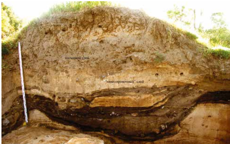
Рис. 4. Свита напластований Центрального городища

С основным горизонтом связаны два массива напластований. Под насыпным горизонтом располагается слой слабоокрашенной супеси мощностью до 0,30–40 м, который накрывал культурный слой гнёздовского времени на общей площади около 400 кв. м, неравномерно распространяясь от западной и южной бровки мыса на 20–25 м в восточном направлении. Относительно ровный характер его поверхности и «затекание» в неровности нижележащего слоя позволяют рассматривать слабоокрашенную супесь в качестве искусственного нивелировочного слоя. Время, после которого был сформирован слой «нивелировки», определяет находка монеты архиепископа Майнца, выпущенная в 1031–1051 гг. и найденная в основании этого слоя. Интересно, что в верхней части того же слоя обнаружен развал средневековой амфоры (рис. 5).