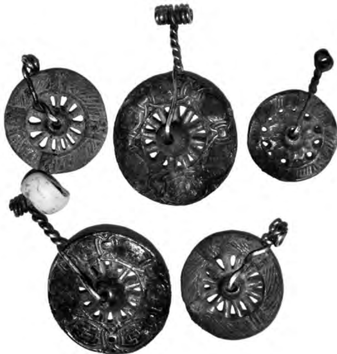
Рис.4. Колесовидные амулеты из медного сплава с позолотой из клада, найденного в Дании в 2015 г.

серебряных сосудов, фибул, подвесок, бусин, браслета, монет арабского и западноевропейского происхождения и пяти позолоченных амулетов, отлитых из медного сплава (рис. 4).