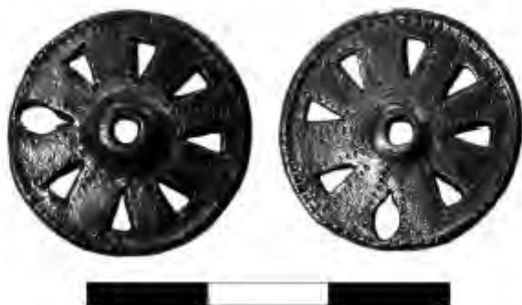
Рис. 8. Миниатюрное колесо из Трусо ( по: Gardeta L., s. 104, fig.23)

случайные находки. Два амулета-колеса обнаружены с помощью металлодетектора в Дании на западе острова Зеландия: это поселение Хессельберг в окрестностях Роскильде и аристократическая усадьба Тиссё, где зафиксирована необычайно плотная концентрация магических предметов, свидетельствующих, что во второй половине X — начале XI вв. эта территория была местом совершения культовых действий и обрядов и одновременно — являлась мастерской по производству украшений и амулетов 16 . Ещё одно миниатюрное колёсико происходит из комплекса постройки X в. поселения Хельгё в Средней Швеции.