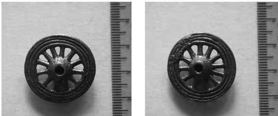
Рис.2. Лицевая и оборотная сторона амулета-колесика из Гнёздова