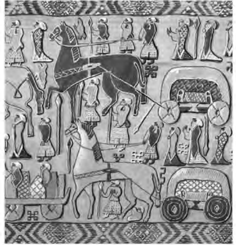
Рис.3. Деревянная повозка (1) и фрагмент гобелена с повозками (2) погребения в Усеберге, Вестфольд, Норвегия (по: 1 – Price N., 2013, p. 182, fig. 254; 2 – Bill J, 2013, p. 200–201, fig. 3)

У германских и славянских народов колесо в качестве символа имеет множество противоречащих друг другу значений. Мифологический источник, дающий ключ к локальному символизму скандинавских амулетов этого типа отсутствует, а «ускользающее» значение объектов, отражающих персональную магическую практику, затрудняет их идентификацию и поиск прямых и однозначных соответствий с представителями северного языческого пантеона. Как утилитарный предмет колесо совмещает в себе мотив круга и кругового движения, а также вращение небесных светил. В культуре разных народов колесо является солярным символом и наделяется апотропейными и демоническими свойствами, а катание колёс присутствует в весенне-летней обрядности 8 .