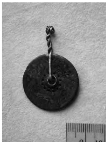
Рис.5. Лицевая и оборотная стороны амулета-колеса из шведской провинции Сконе, случайная находка SHM 9822:812