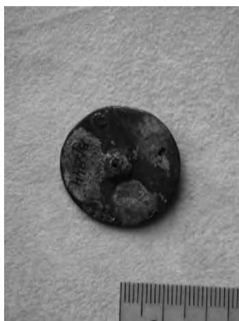
Рис. 6. Лицевая и оборотная сторона амулета-колеса из погребения 844 в Бирке. SHM 5802:844

в Дании и Швеции (Сконе) известно 10 экземпляров. Из самой южной шведской провинции происходит миниатюрное колесо с короткими спицами и широким ободом, на котором разместился роскошный зооморфный орнамент в стиле Борре с тремя рогатыми анфасными личинами, шестью птичьими головами с большими клювами и сложным переплетением когтистых лап, копыт и двойных лент (рис. 5). 12 спиц отделяют друг от друга круглые отверстия. Этот амулет выполнен из серебра, его лицевая поверхность укра-