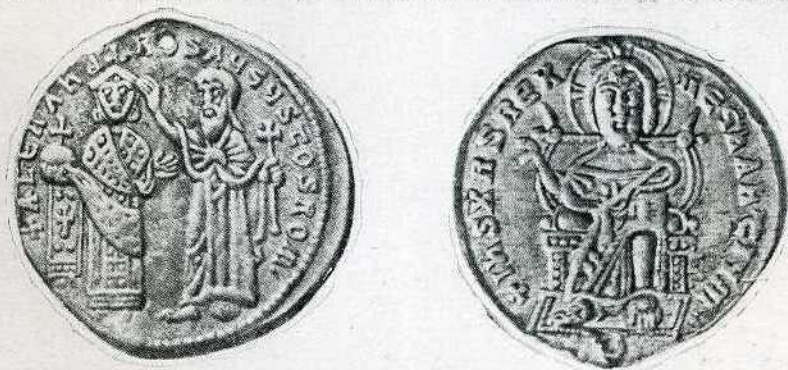
Рис. 22. Гнездовское городище. Подвеска. а — аверс, б — реверс.

1 — серебряная цепь; 2 — золотая подвеска филигранной работы; 3 — золотое колечко с бусиной из синего стекла; 4 — серебряная бляха; 5 — пуговица с зернью; 6 — костяная ложка с фигурной рукоятью.