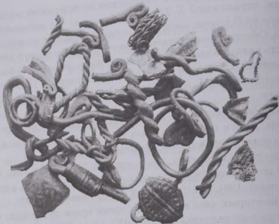
Рис. 1. Фрагмент предметной части клада до расчистки.